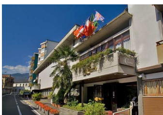
L'ingresso dell'Hotel "Il Chiostro"

Per l'Hotel " Il Chiostro ", scendere alla fermata di Piazza Cavour e...chiedere all'autista! L'Hotel è lì vicino e sarà molto semplice per lui indicarVi la strada (cosa che risulta invece difficile da spiegare).