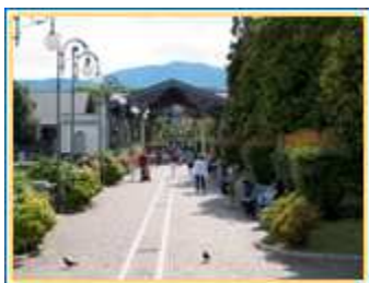
L'imbarcadero vecchio e il lungo lago per raggiungere Villa Caramora

Per Villa Caramora , scendere alla fermata Imbarcadero Vecchio di Intra e proseguire sul lungolago per c.a 200 mt. Troverete la Villa alla Vostra sinistra.