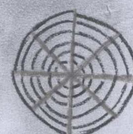
Le paure di Federico ...