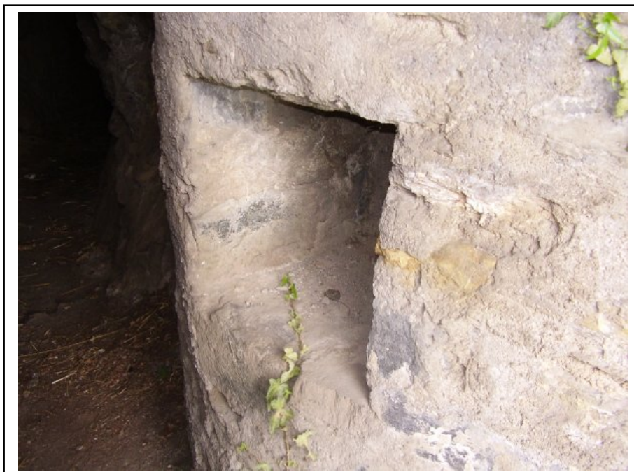
L'interno di una galleria di collegamento tra trincee

Il tratto piemontese della "linea Cadorna" comprende il sistema del Monte Massone-Corni di Nibbio, la linea di trincee e postazioni che dal Monte Zeda scende al lago, con il Monte Spalavera e il Monte Morissolo e infine il centro logistico del Montorfano, la sentinella di granito dove erano il posto di comando, polveriere e piazze per l'artiglieria campale. Bunker per mitragliatrici furono costruiti nella campagna di Cuzzago e di Migliandone e davanti ad essi erano prevista la posa di reticolati.