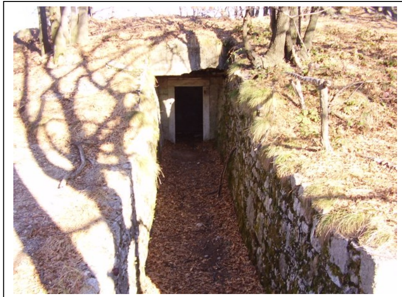
Bunker in vetta