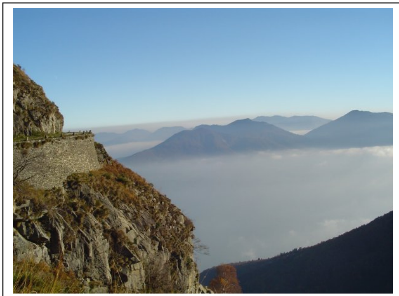
Mulattiera e panorama verso il Morissolo

Superati i venti di guerra, la linea è oggi una risorsa turistica da valorizzare.