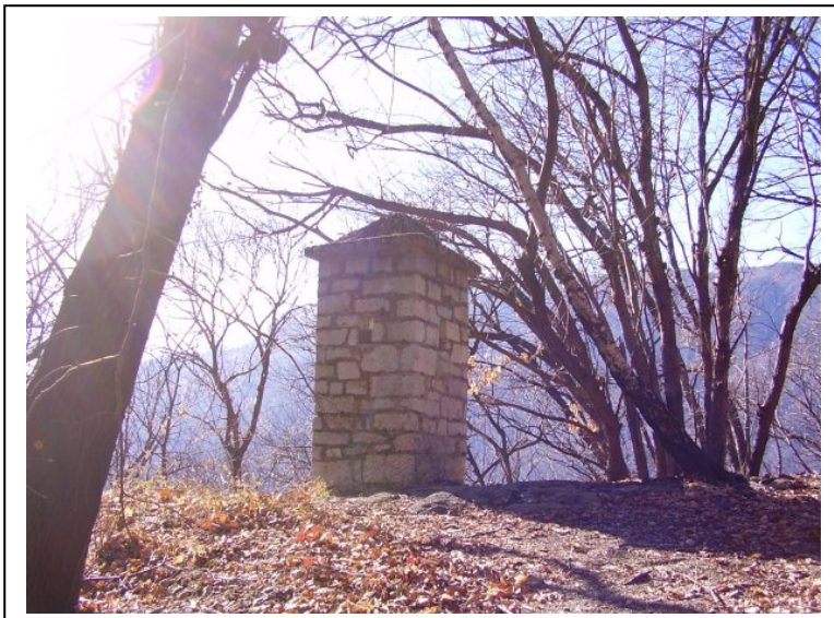
Postazione per la sentinella