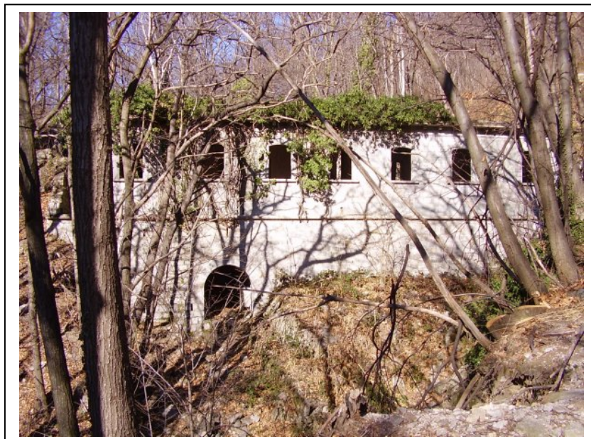
Caserma verso la cima del Montorfano

In particolare, negli ultimi anni, è stata resa agibile la mulattiera del Montorfano che permette di raggiungere le imponenti opere di vetta, che avrebbero dovuto ospitare alcuni pezzi di artiglieria ma che sono rimaste poi incompiute.