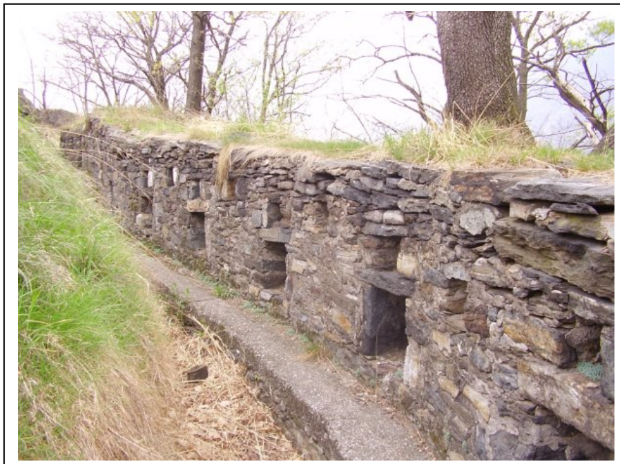
Trincee presso Migliandone

Un lavoro di migliaia di uomini sui monti per la costruzione di una linea difensiva realizzata nel periodo della prima guerra mondiale. Nacquero centinaia di chilometri di trincee, postazioni militari, centinaia di chilometri di strade e mulattiere, che hanno cambiato il volto delle nostre montagne.