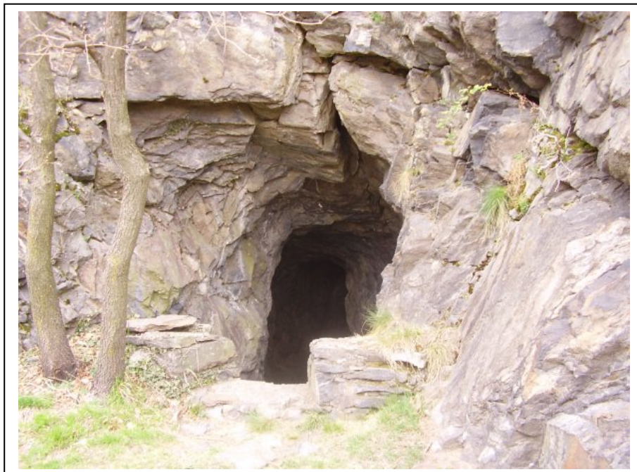
Trincee e ingresso galleria sopra Migiandone