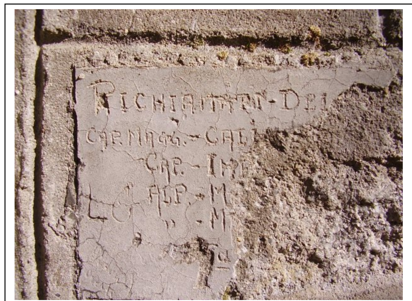
Incisione sul muro della caserma