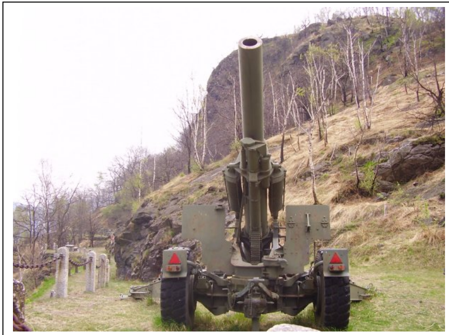
Obice presso il Forte