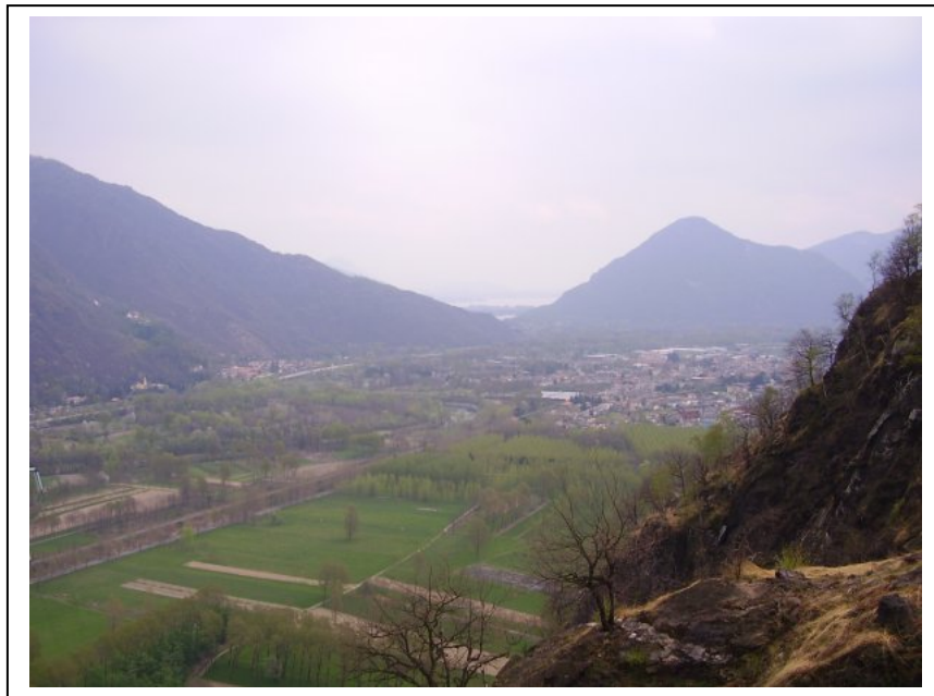
Il punto più stretto all'imbocco della Val d'Ossola

Poco più avanti la cima fortificata del Montorfano controlla lo sbocco della valle.