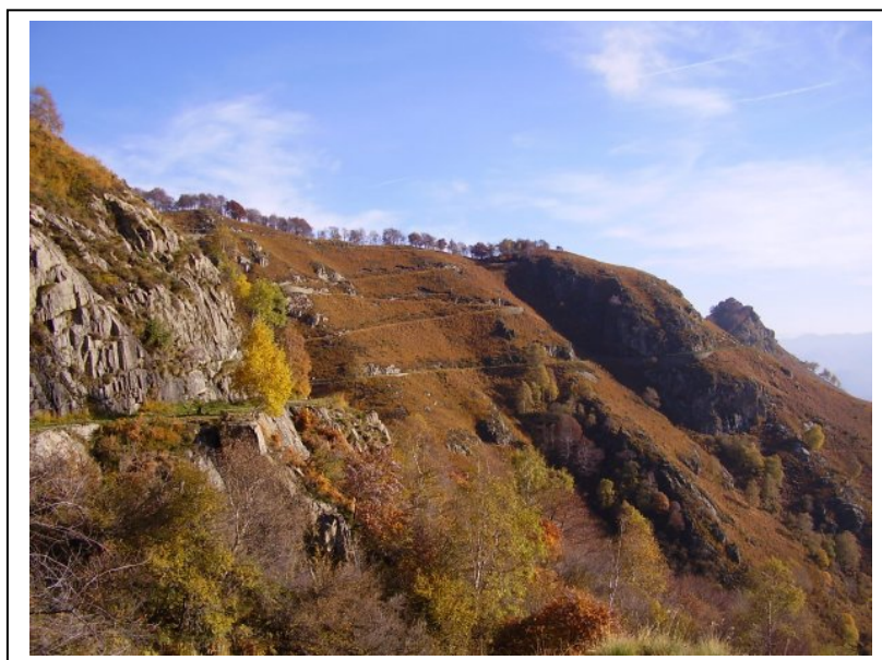
La mulattiera verso il Monte Morissolo

Si costituirono imprese per i lavori edilizii, crebbe l'attività estrattiva e fu impiegata anche manodopera femminile per il trasporto dei viveri e dei rifornimenti ai militari e agli operai al lavoro in montagna.