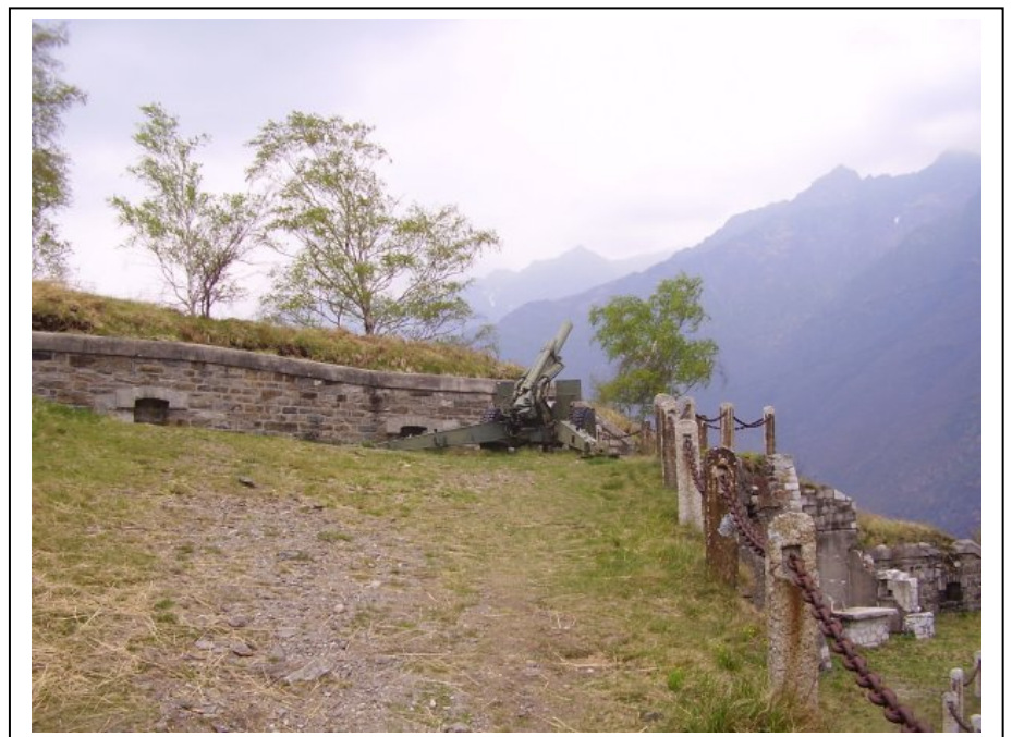
In fondo l'alta Val d'Ossola

Nell'Alto Verbano, la linea Cadorna ha trascurato l'inaccessibile Valgrande, interessando invece la lunga dipluviale che dal monte Zeda scende al lago Maggiore. Punto nevralgico del sistema difensivo era il monte Morissolo, traforato da gallerie e postazioni sotterranee. Oggi è possibile raggiungere comodamente la zona da Intra, passando per Premeno e Piancavallo. Una prima passeggiata ha come metà il Monte Morissolo, un autentico balcone panoramico sul Lago. L'escursione con dislivelli minimi richiede circa un'ora. Per motivi di sicurezza è sconsigliabile avventurarsi tra i resti delle fortificazioni.