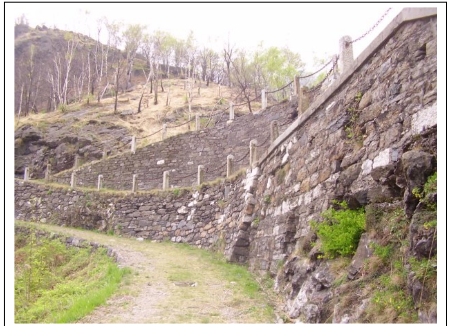
Arrivo al Forte