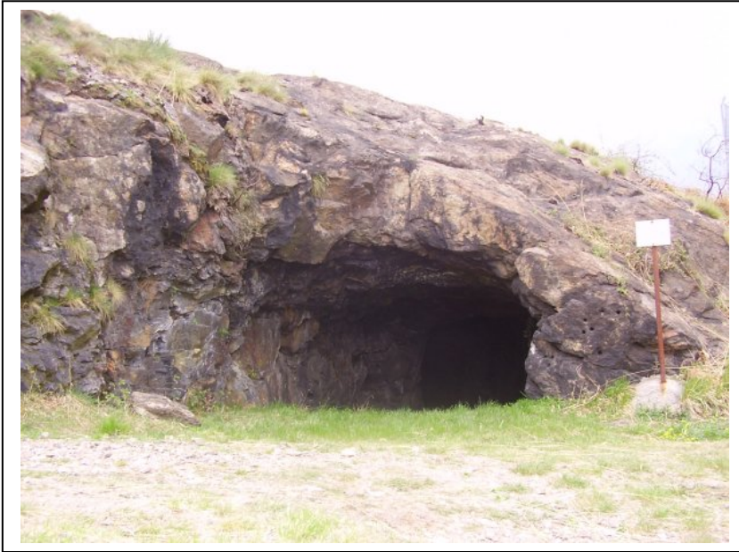
Galleria presso il Forte di Bara

Alcuni tunnel scavati nella roccia collegano la mulattiera di servizio e il forte alle trincee. Una strada di accesso, strada militare camionabile è stata costruita dal genio militare nel 1913 e va dalla chiesa della “Madonna della Guardia” di Ornavasso fino al confine di Migiandone. È solo una della 14 strade di montagna volute da Cadorna nell’alto novarese con uno sviluppo complessivo di 64 km.