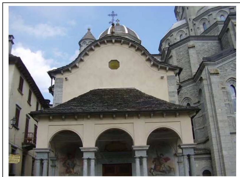
SMS di Piancavallo

Il porticato esterno, invece, è stato costruito nel 1806, insieme alla nuova facciata con le scene del miracolo.