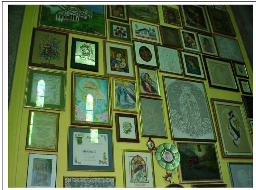
La raccolta di ex voto

Il tema più frequente è quello della Madonna con le stimmate del sangue, in genere collocata sul fondo del dipinto. Da queste rappresentazioni di “miracoli ricevuti” emerge la vita di ieri e di oggi, i diversi mestieri, gli strumenti di lavoro, i mezzi di comunicazione. L'ex voto più antico è del 1658 e rappresenta un evento accaduto in Germania. Molte sono anche le foto.