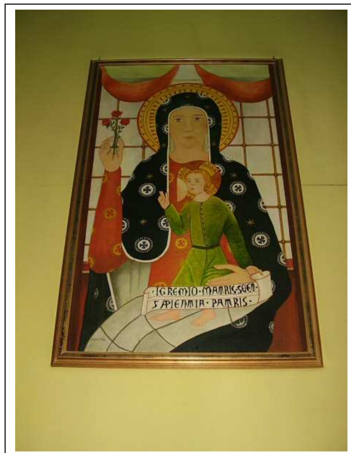
La Madonna del Sangue di Re